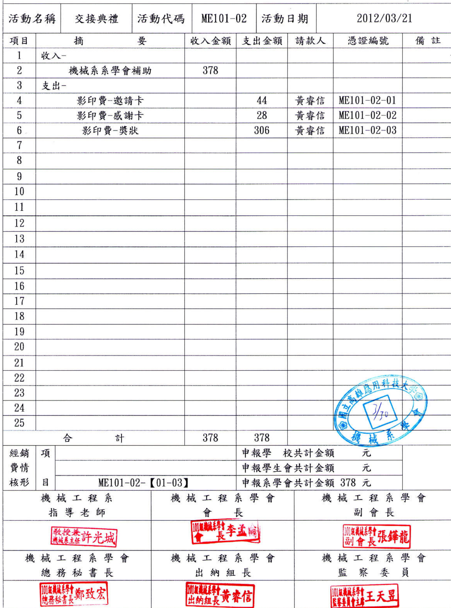
國立高雄應用科技大學一零一級機械工程系學會活動經費收支明細表